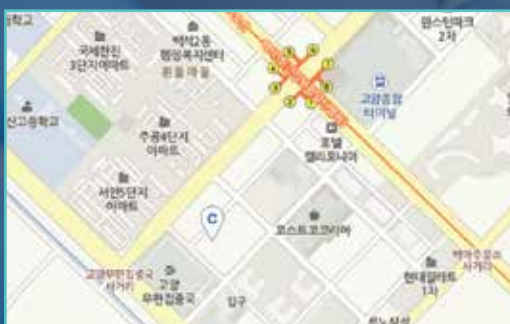
연세예스치과의원 (원장 박경준) 경기도 고양시 일산동구 호수로 358-25 (백석동)